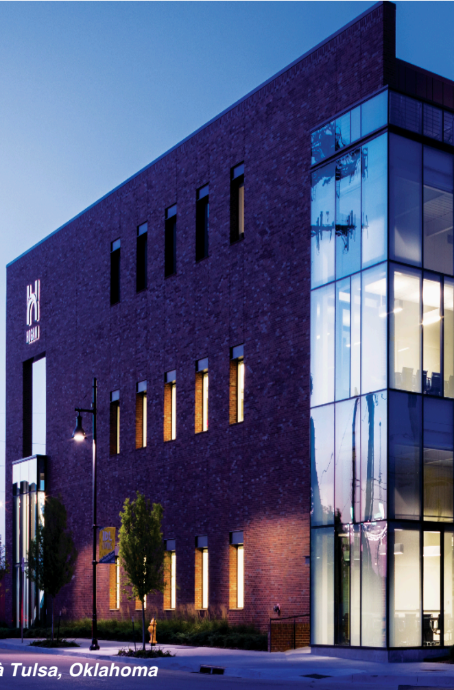
Le siège Hogan à Tulsa, Oklahoma